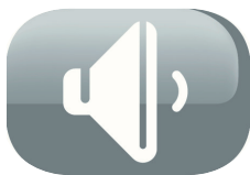
Faible niveau sonore