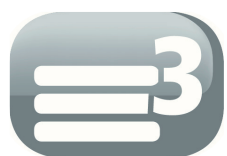
3 couches de filtre