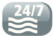
Possibilité de drainage permanent